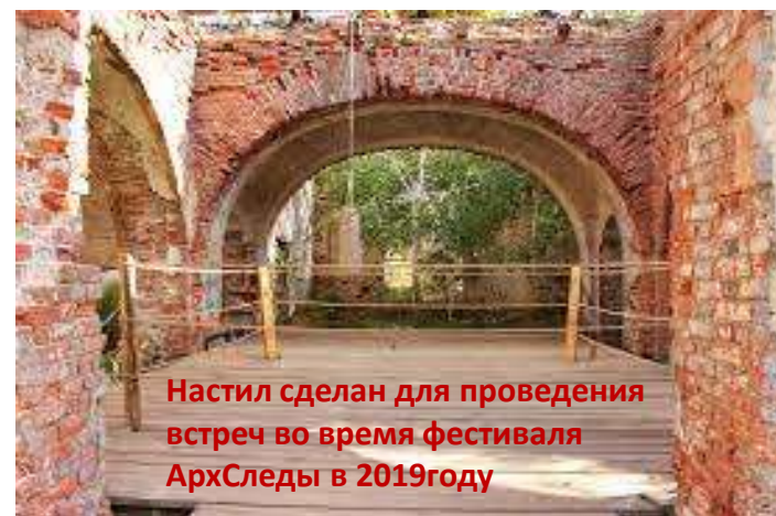
Настил сделан для проведения встреч во время фестиваля АрхСледы в 2019 году