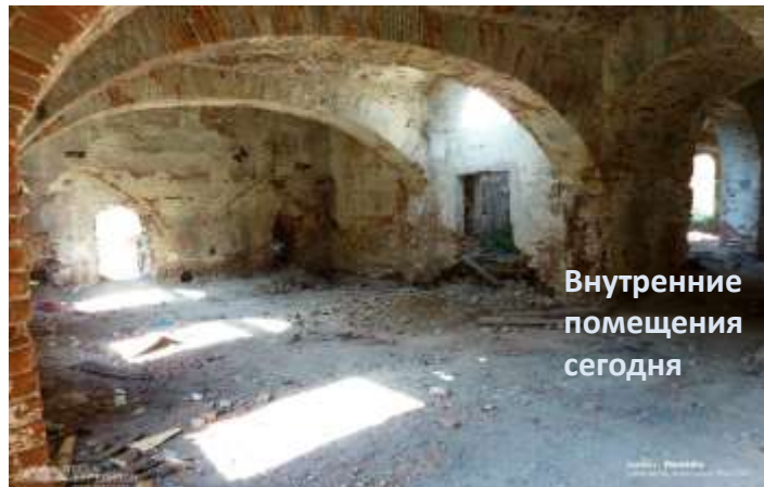
Внутренние помещения сегодня