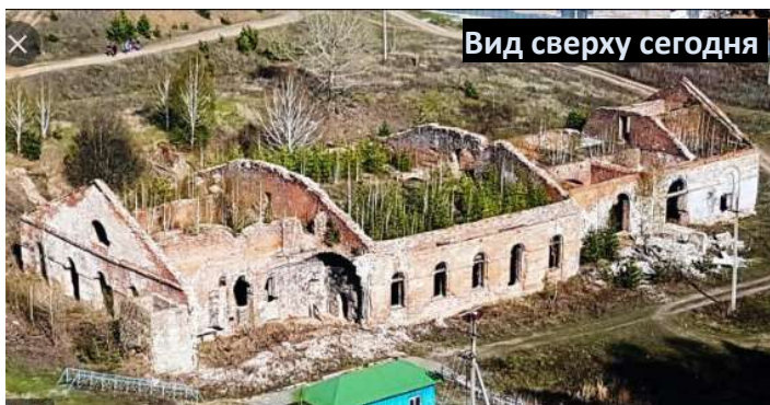
Вид сверху сегодня